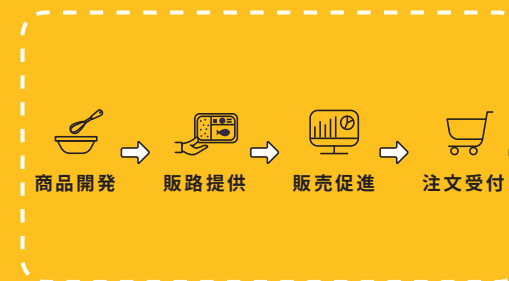
スターフェスティバルがサポート

また、最大級のモールを運営する弊社ならではの、製造・ 物流ネットワークや販売チャネルを活用したサービスも 行っています。