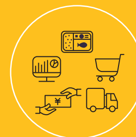
EC参入ソリューション

そのノウハウ・顧客基盤をもとに、「ソリューション」と 「販路」の両軸から、飲食店の中食・ECビジネス参入を 支援します。